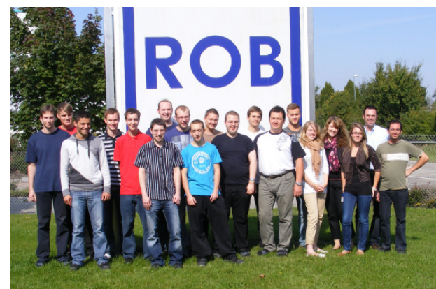
Unser Azubi-Team 2010/2011

Starten Sie mit Ihrer Ausbildung bei uns durch!