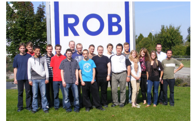
Unser Azubi-Team 2010/2011

Starten Sie mit Ihrer Ausbildung bei uns durch!